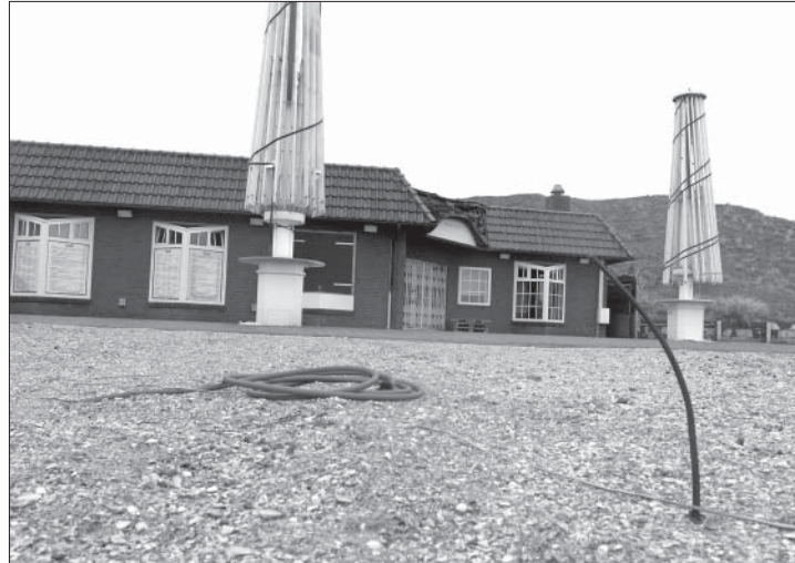
Im September soll der Umbau an der Oase beginnen.

(syk) – Das Lokal „Oase“ am FKK-Strandaufgang ist bei den Gästen ein beliebtes Ausflugsziel. Seit 2016 gibt es dort eine provisorische Bewirtung, die es auch noch in dieser Saison geben wird. Der Grund: Die Staatsbad GmbH, die Eigentümerin des Gebäudes ist, hat erst im Januar die Genehmigung vom Landkreis Aurich für den Umbau erhalten. Dennoch können mit den Arbeiten erst im Laufe des Septembers begonnen werden, da sich die Oase in einem Sondergebiet, also mitten im Nationalpark, befindet. Und hier darf während der Brutzeiten, die im März beginnen, nicht gebaut werden. Dies teilt Kurdirektor Wilhelm Loth in einem Pressegespräch mit. Die Naturschutzbehörde des Landkreises hatte wegen der