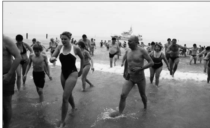
Kurz rein und dann ganz schnell wieder raus: Anbaden am Weststrand.