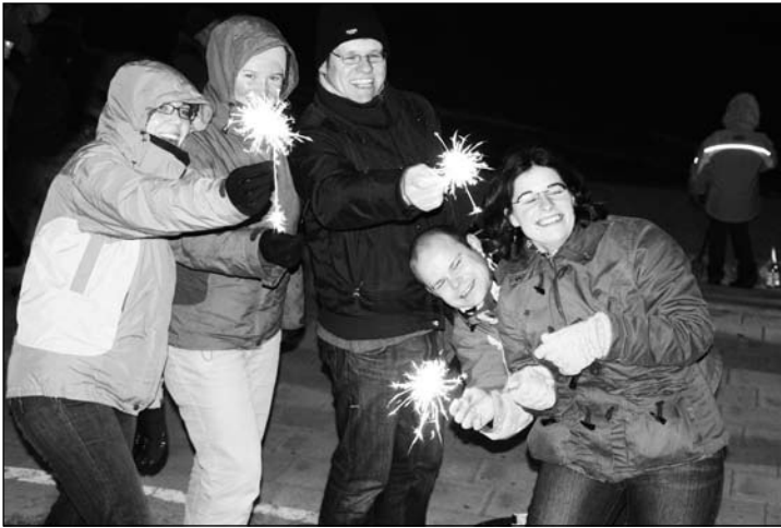
Frohes neues Jahr: Feiern des Quintett um Mitternacht am Weststrand.