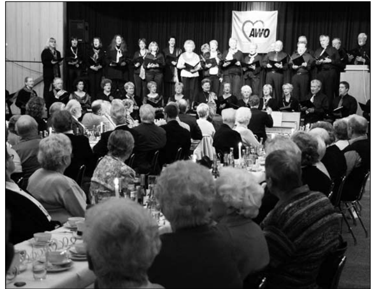
Der Auftritt des Norderneyer Inselchors, der sich offiziell zum 1. Januar 2009 gegründet hat.