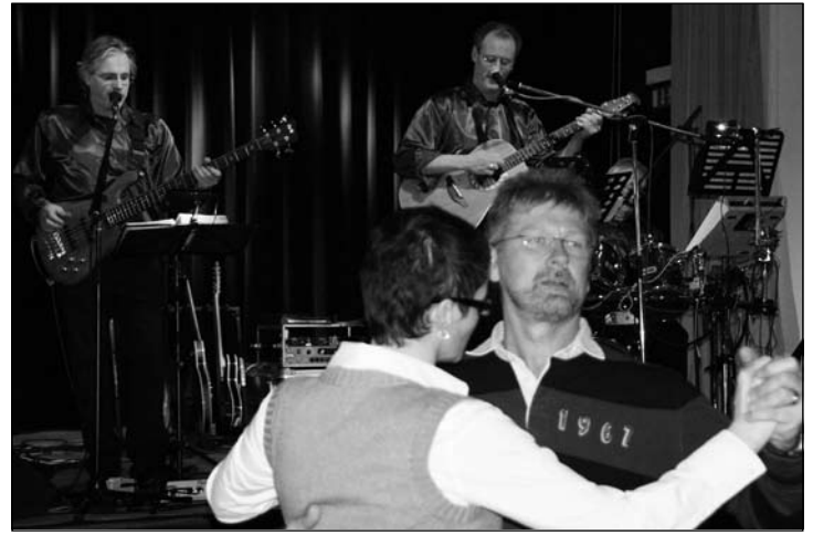
Tanzbar und schwungvoll: „Les Ossi“ spielten im Conversationshaus.