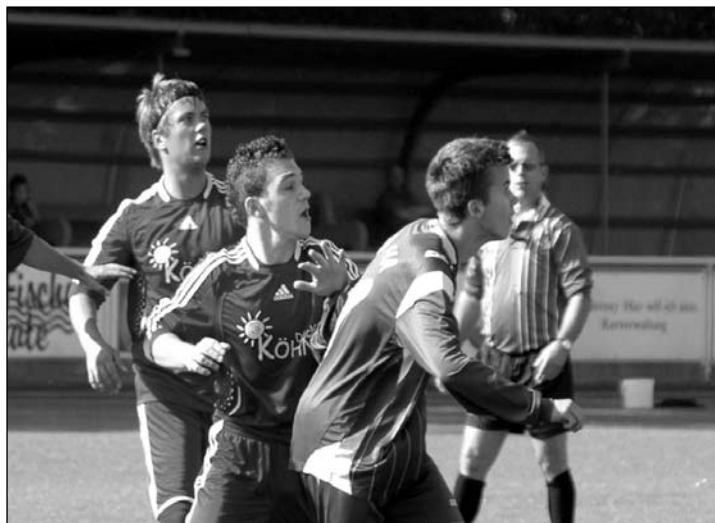
Der TuS steht derzeit auf dem elften Tabellenplatz.