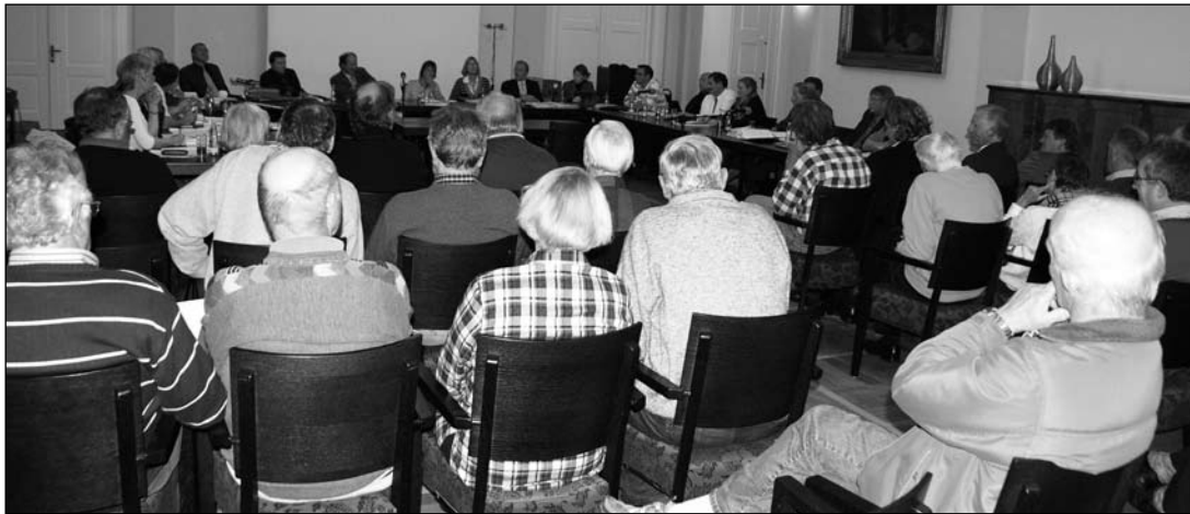
Warteten vergebens auf die Verkehrsdiskussion: Zuschauer im Weißen Saal im Conversationshaus.

Der Rat hält seine nächste Sitzung am Montag, 17. November, um 18 Uhr im Weißen Saal des Conversationshauses ab.