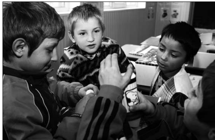
Rumänische Kinder freuen sich über Weihnachtsgeschenke.